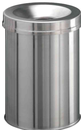
Papierkorb EDELSTAHL SAFE, metallic silber