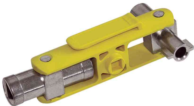
Schaltschrank-Schlüssel, 6 in 1