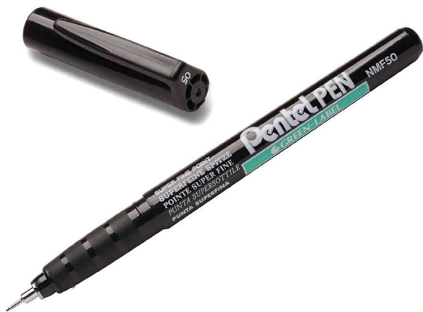
Permanent-Marker GREEN-LABEL NMF50