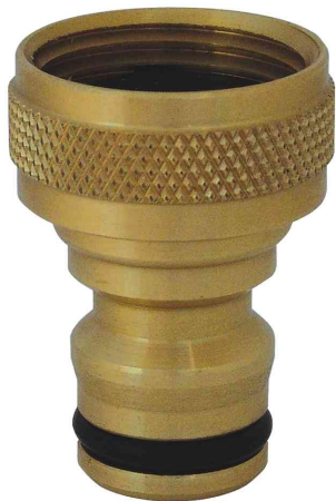
Wasserhahnanschlussstück für 1/2" Gewinde