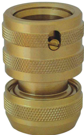
Endanschlussstück für 1/2" Wasserschläuche, mit Wasserstopp