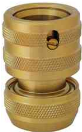
Endanschlussstück für 3/4" Wasserschläuche