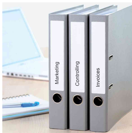
Orderrücken-Etiketten SPECIAL, Anwendung