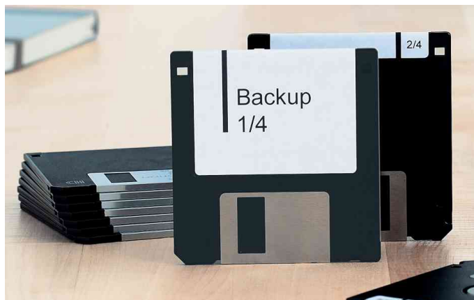
Disketten-Etiketten 3,5" SPECIAL, Anwendung