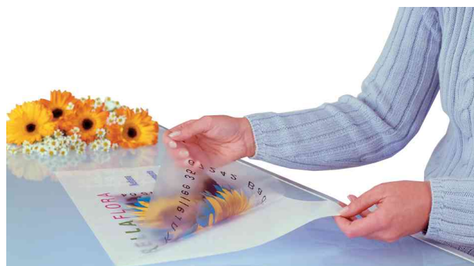
Folienetiketten DIN A3, Anwendung