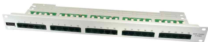
19" ISDN Patch Panel, 25 Port