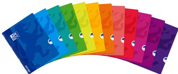
visuel de référence: Cahier "OpenFlex"