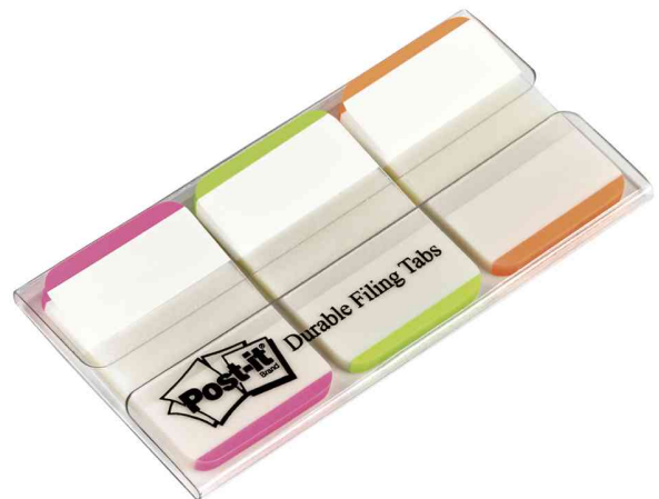
Haftmarker Index Strong, pink/grün/orange