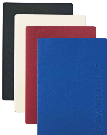
Bewerbungsmappe "Solo", alle Farben