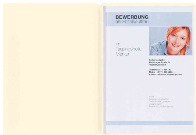
Bewerbungsmappe "Solo", beige