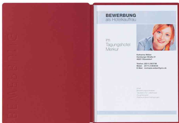
Bewerbungsmappe "Solo", rot