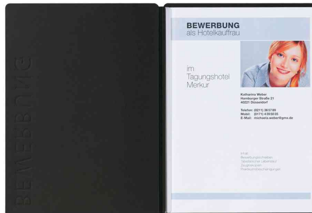
Bewerbungsmappe "Solo", schwarz