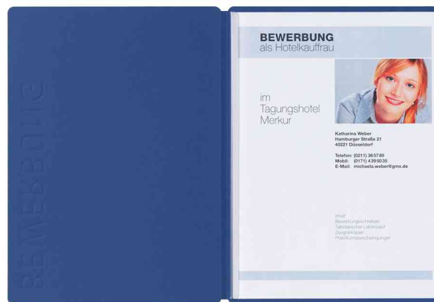
Bewerbungsmappe "Solo", blau