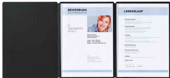
Bewerbungsmappe "Supreme", schwarz