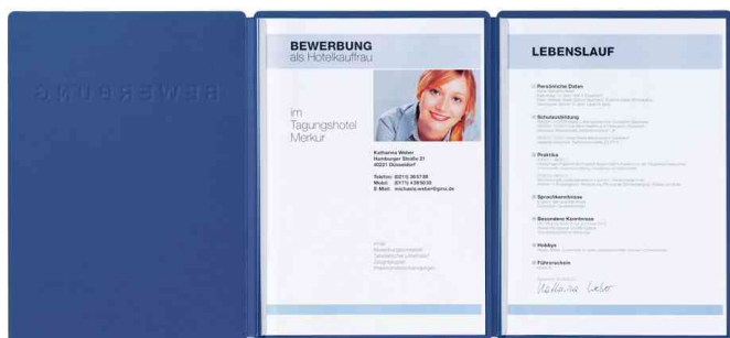
Bewerbungsmappe "Supreme", blau