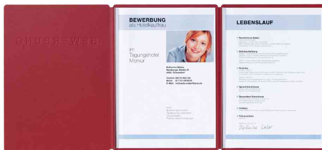
Bewerbungsmappe "Supreme", rot