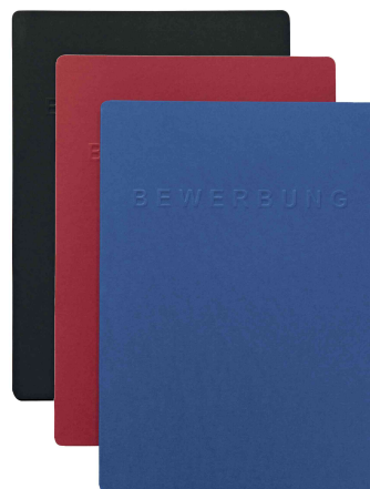
Bewerbungsmappe "Supreme", geschlossen