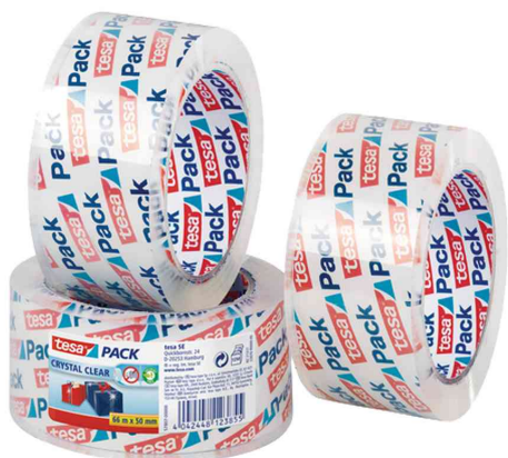
tesapack® Verpackungklebeband crystal clear