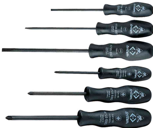
Schraubendrehersatz 6 teilig, Schlitz / Phillips