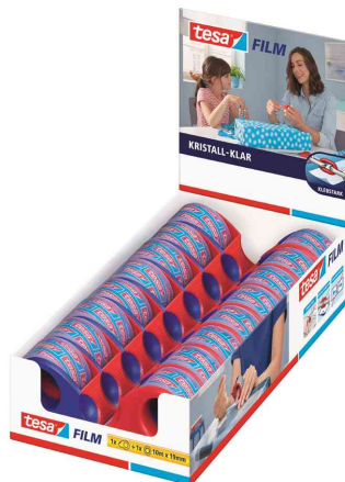
Mini Abroller, im Thekendisplay

- offener Abrollkern ermöglicht das Tragen am Finger und ungehinderten Einsatz beider Hände