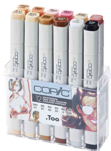
Marker ciao, 12er Set Hautfarben