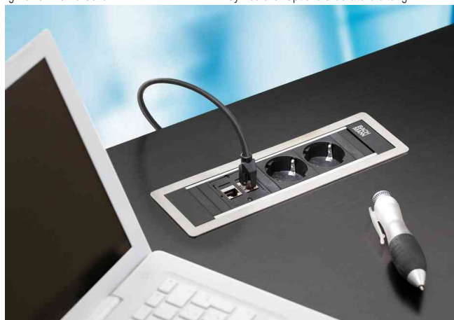
Zeigt das Produkt in Anwendung