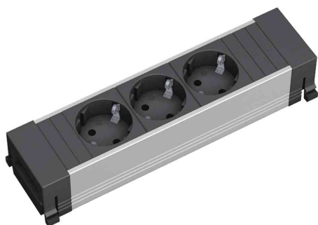
Steckdoseneinheit Power Frame