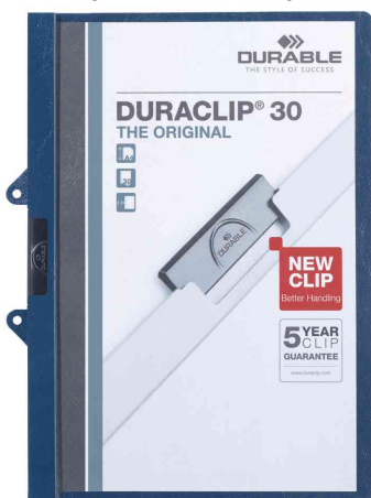
Klemmhefter DURACLIP® 30 EASY FILE