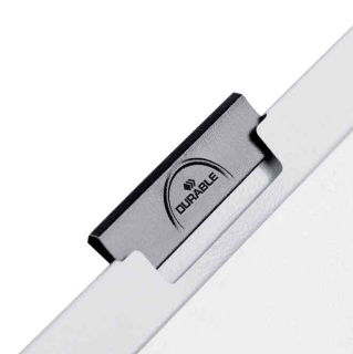
Herausziehbare, schwarze Klemme