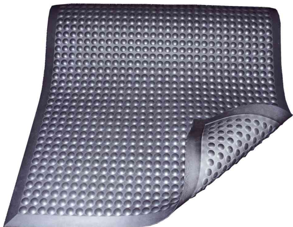
Arbeitsplatzmatte Yoga Ergo Fire