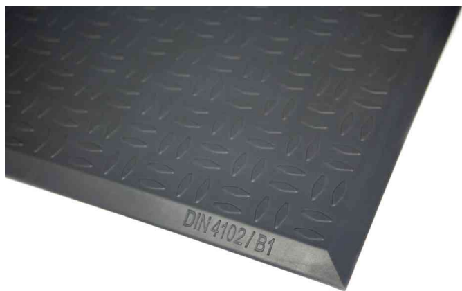
Arbeitsplatzmatte Yoga Ergo Fire, Riffelprofil