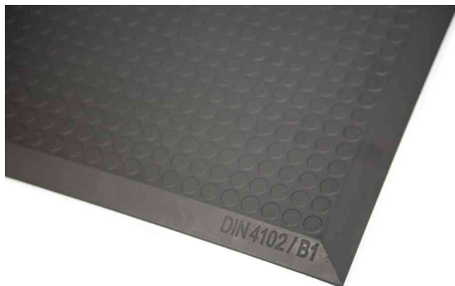
Arbeitsplatzmatte Yoga Ergo Fire, Flachnuppenprofil