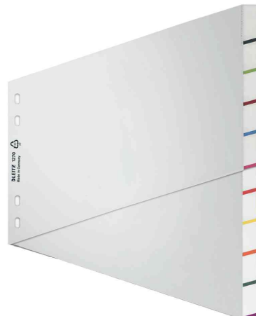
Blanko Kunststoff-Register Premium, Schrägregister