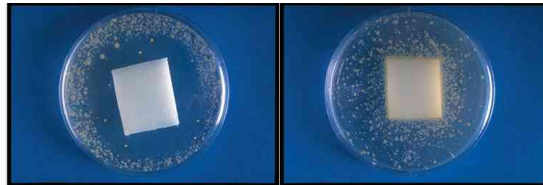
mit Microban-Schutz / ohne Microban-Schutz