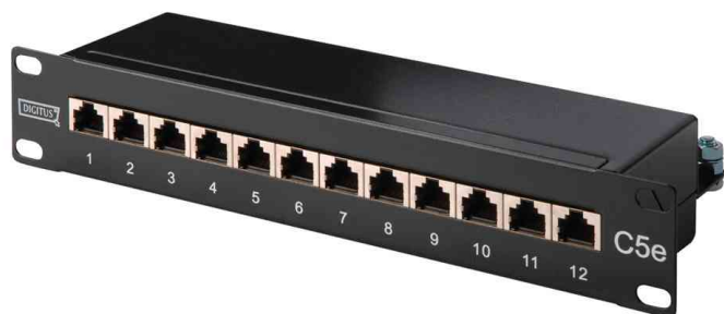
10" Patch Panel, Kat. 5e, geschirmt, 12 Port