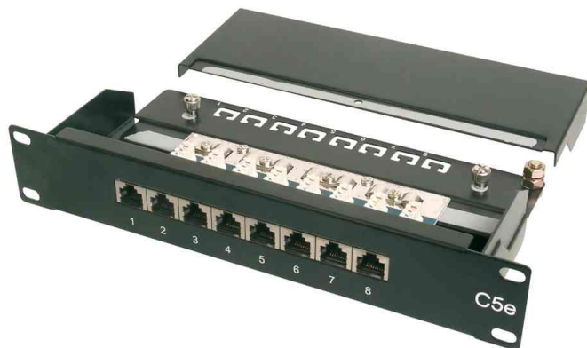
10" Patch Panel, Kat. 5e, geschirmt, 8 Port