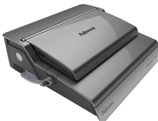
Elektrisches Plastikbindegerät Galaxy E 500, geschlossen