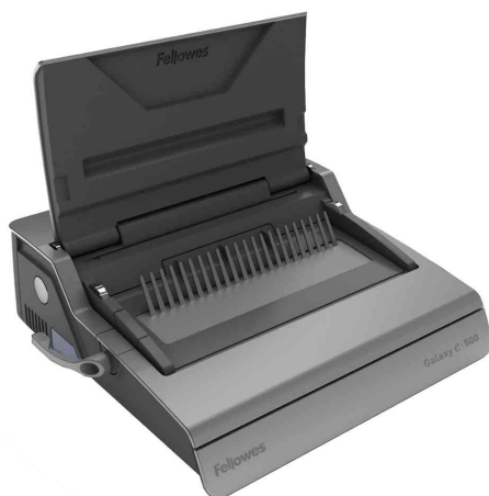
Elektrisches Plastikbindegerät Galaxy E 500