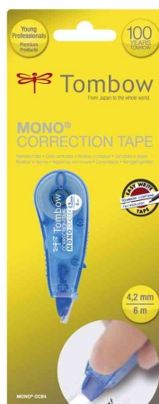
Korrekturroller "MONO CT-CCE4", blau