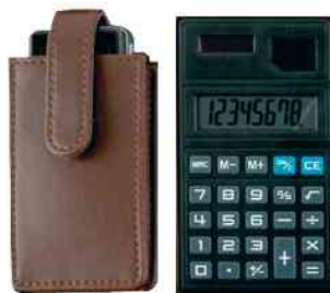
Handytasche - Taschenrechner