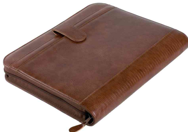
Ringbuchmappe "VITERBO", geschlossen