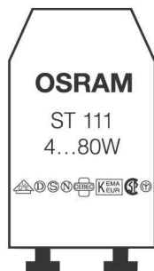
Starter ST 111 LONGLIFE

- zum Zünden / Starten von Leuchtstofflampen