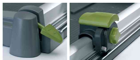
integrierte Klemmschiene - Messerkopf