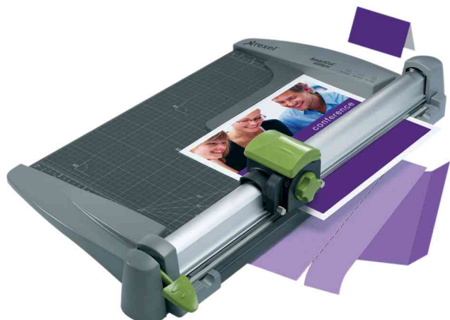
Rollen-Schneidemaschine SmartCut A525pro