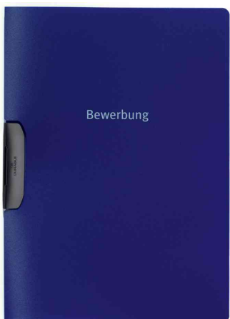
Bewerbungsmappe DURASWING® JOB, dunkelblau