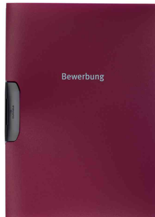
Bewerbungsmappe DURASWING® JOB, bordeaux