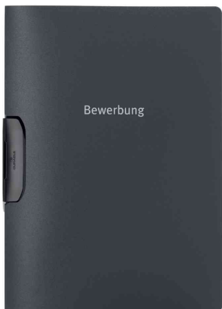
Bewerbungsmappe DURASWING® JOB, anthrazit