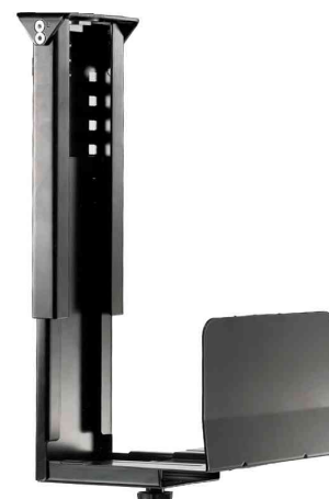
CPU-Halter für PC-Tower, starr - schwarz