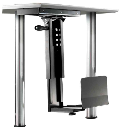
CPU-Halter für PC-Tower, dreh- und ausziehbar - schwarz