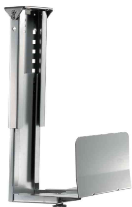
CPU-Halter für PC-Tower, starr - silbergrau