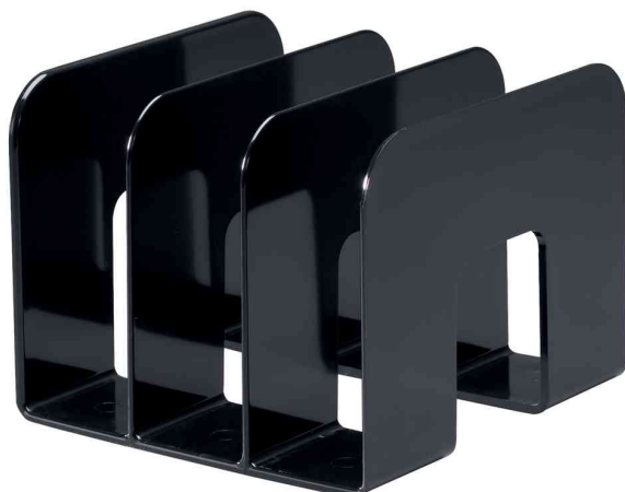
Buchstütze TREND, schwarz