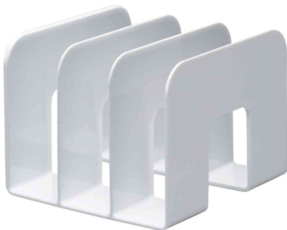
Buchstütze TREND, weiß