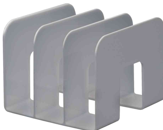
Buchstütze TREND, grau