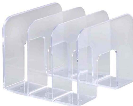
Buchstütze TREND, transparent