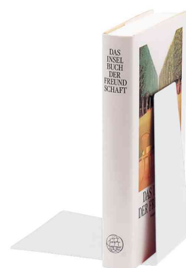
Buchstütze, weiß, in Anwendung