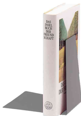
Buchstütze, grau, in Anwendung