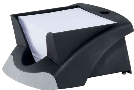
NOTE BOX VEGAS, schwarz / silber