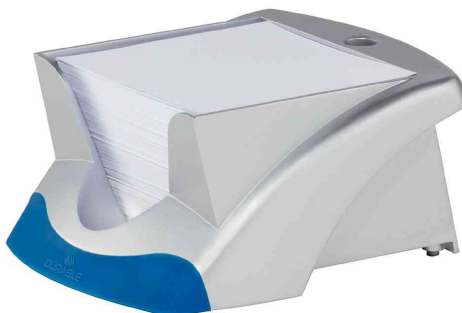
NOTE BOX VEGAS, silber / blau