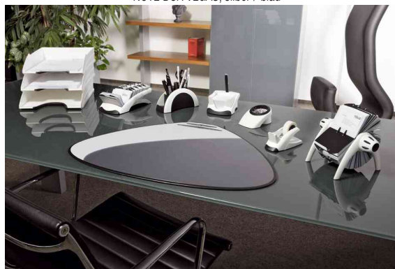
Anwendungsbeispiel - komplette Serie