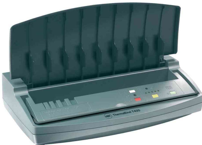
Thermobindegerät ThermaBind T400