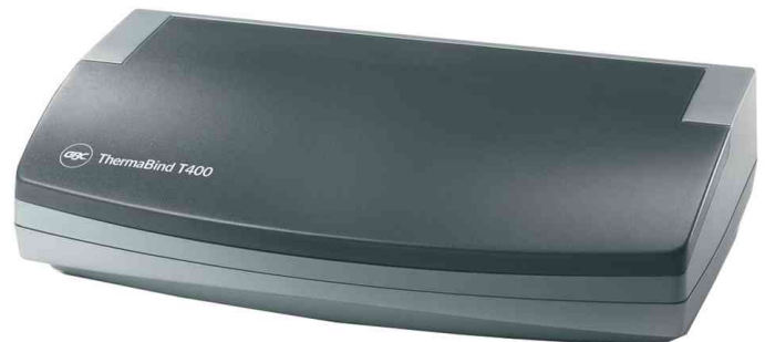
Thermobindegerät ThermaBind T400, geschlossen