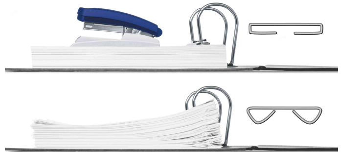
Flachhefttechnologie spart 30% Platz