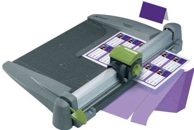
Rollen-Schneidemaschine SmartCut A515pro