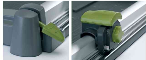
integrierte Klemmschiene - Messerkopf