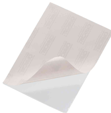
Selbstklebetaschen POCKETFIX®, Rückseite