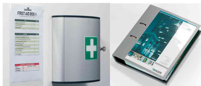
Selbstklebetaschen POCKETFIX®, Anwendungsbeispiel