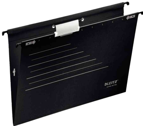
ALPHA Active Hängemappe, schwarz