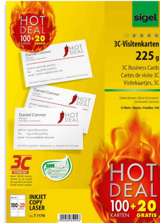
Visitenkarten 3C "HOT DEAL"