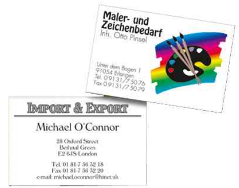
Visitenkarten 3C, Anwendungsbeispiel