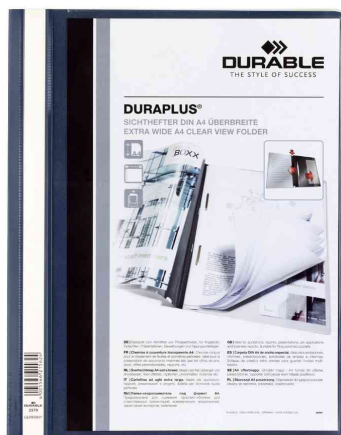
Schnellhefter DURAPLUS®, dunkelblau