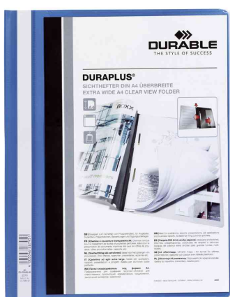
Schnellhefter DURAPLUS®, blau