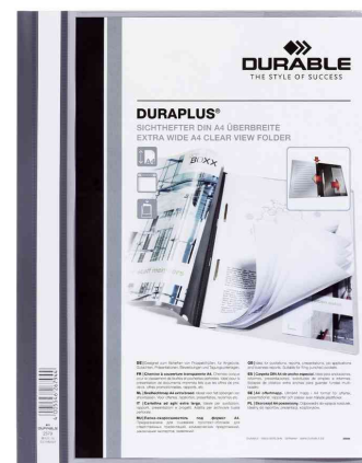
Schnellhefter DURAPLUS®, grau