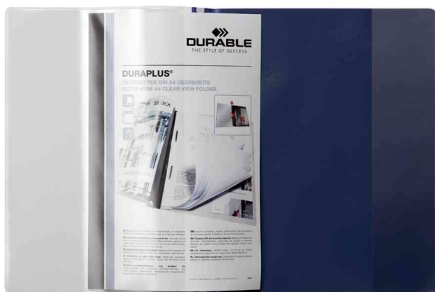
Schnellhefter DURAPLUS®, offen