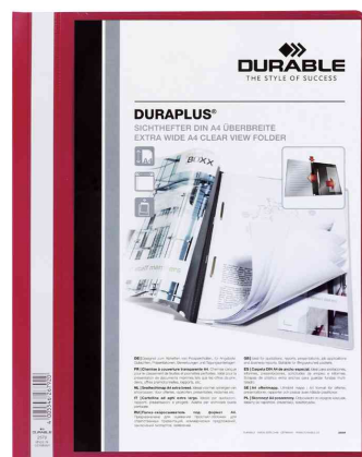
Schnellhefter DURAPLUS®, rot