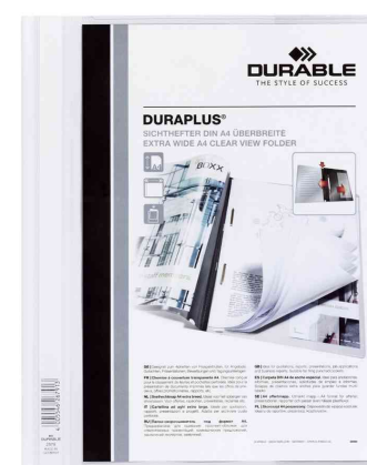
Schnellhefter DURAPLUS®, weiß