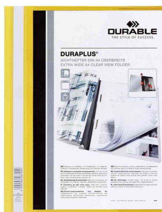
Schnellhefter DURAPLUS®, gelb