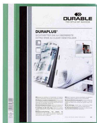
Schnellhefter DURAPLUS®, grün