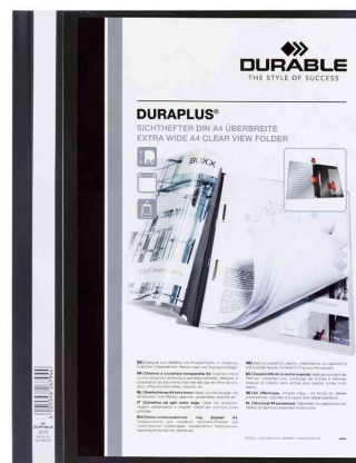
Schnellhefter DURAPLUS®, schwarz