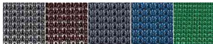
hellgrau - braun - anthrazit- metallicblau - grün