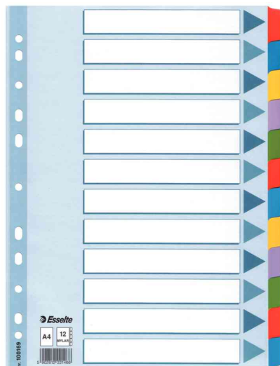
Blanko Karton-Register, 12-teilig