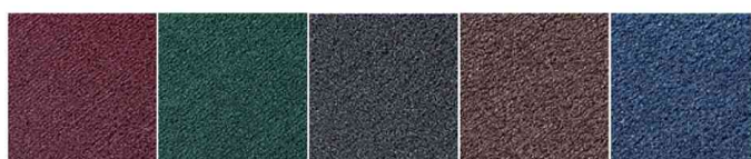
weinrot - grün - grau - braun - blau