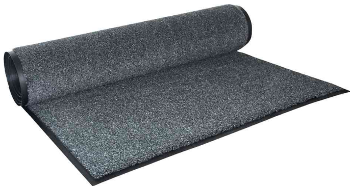
Schmutzfangmatte EAZYCARE AQUA