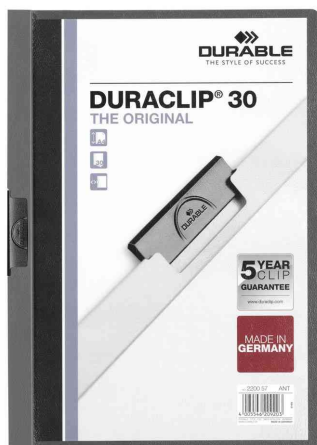
Klemmhefter DURACLIP® Original 30, anthrazit