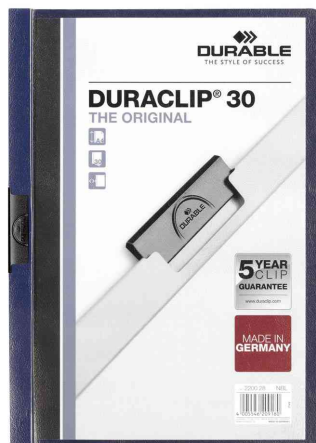
Klemmhefter DURACLIP® Original 30, nachtblau