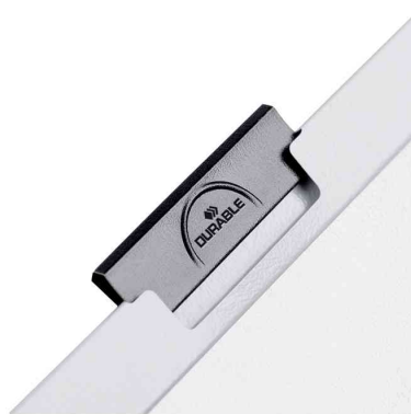
Herausziehbare, schwarze Klemme