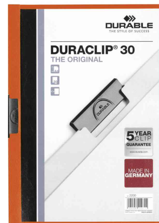
Klemmhefter DURACLIP® Original 30, orange