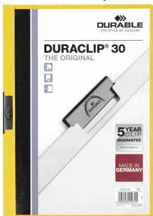
Klemmhefter DURACLIP® Original 30, gelb