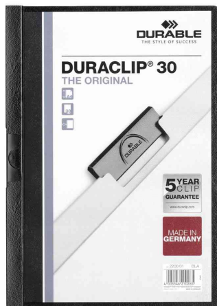
Klemmhefter DURACLIP® Original 30, schwarz