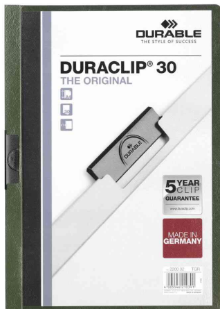
Klemmhefter DURACLIP® Original 30, petrol