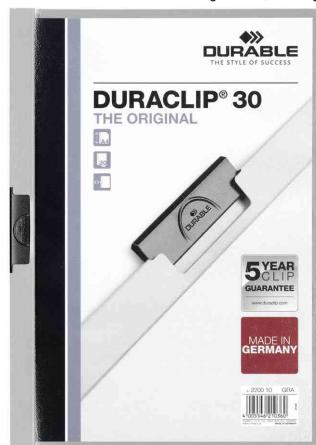
Klemmhefter DURACLIP® Original 30, grau