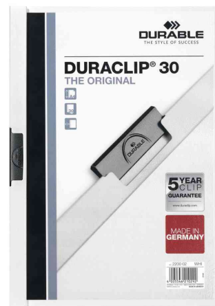
Klemmhefter DURACLIP® Original 30, weiß