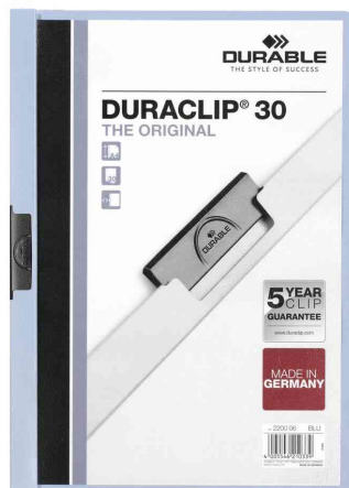
Klemmhefter DURACLIP® Original 30, hellblau