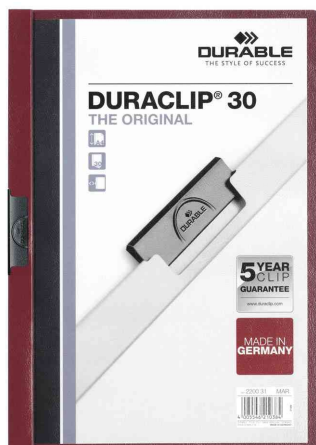
Klemmhefter DURACLIP® Original 30, aubergine