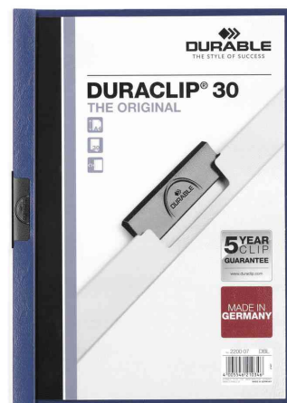
Klemmhefter DURACLIP® Original 30, dunkelblau