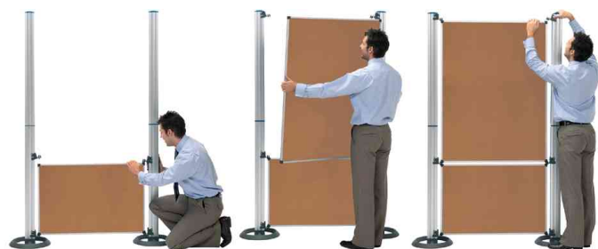
einfacher Aufbau mit 3 Handgriffen