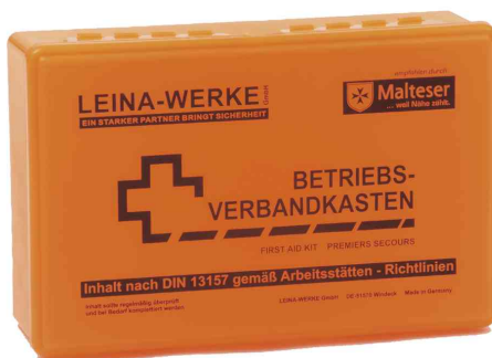
Betriebs-Verbandkasten DIN 13157, orange