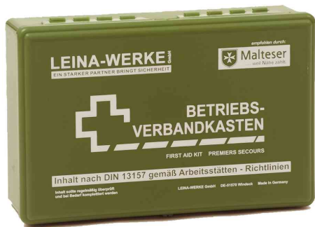
Betriebs-Verbandkasten DIN 13157, grün