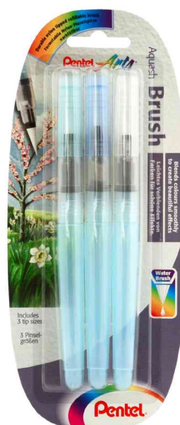
Aquash Pinselstift, 3er Set