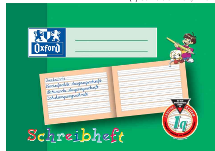
(2) Schreibheft (Lineatur 1 q)