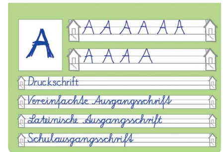
(1) Schreiblernheft, innen