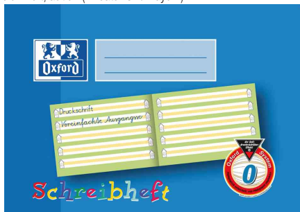
(2) Schreibheft (Lineatur O / Bayern)