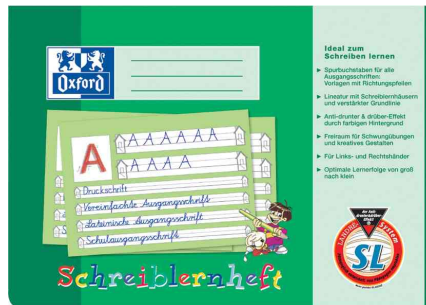
(1) Schreiblernheft, außen (Lineatur SL)