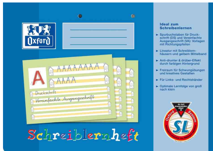
(1) Schreiblernheft, außen (Lineatur SL / Bayern)